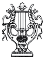
Filarmonica Intercomunale Quistello - Poggio Rusco

La Filarmonica Intercomunale di Quistello-Poggio Rusco porge i suoi tradizionali auguri a tutta la cittadinanza con il consueto concerto di Natale. Come sempre il repertorio spazierà tra vari generi, dalla musica classica alle colonne sonore, passando per originali composizioni per banda.